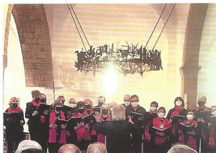
Festa Sant Medir.