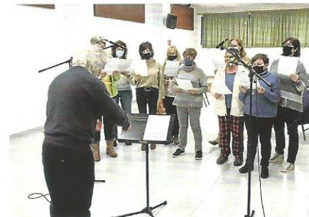
Enregistrament Cant de lluita.