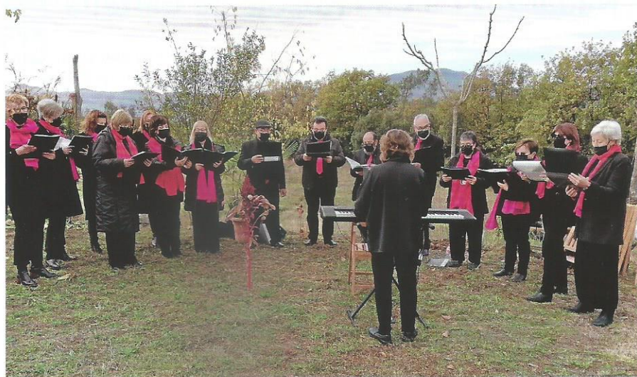
Santa Cecília de Les Serres.